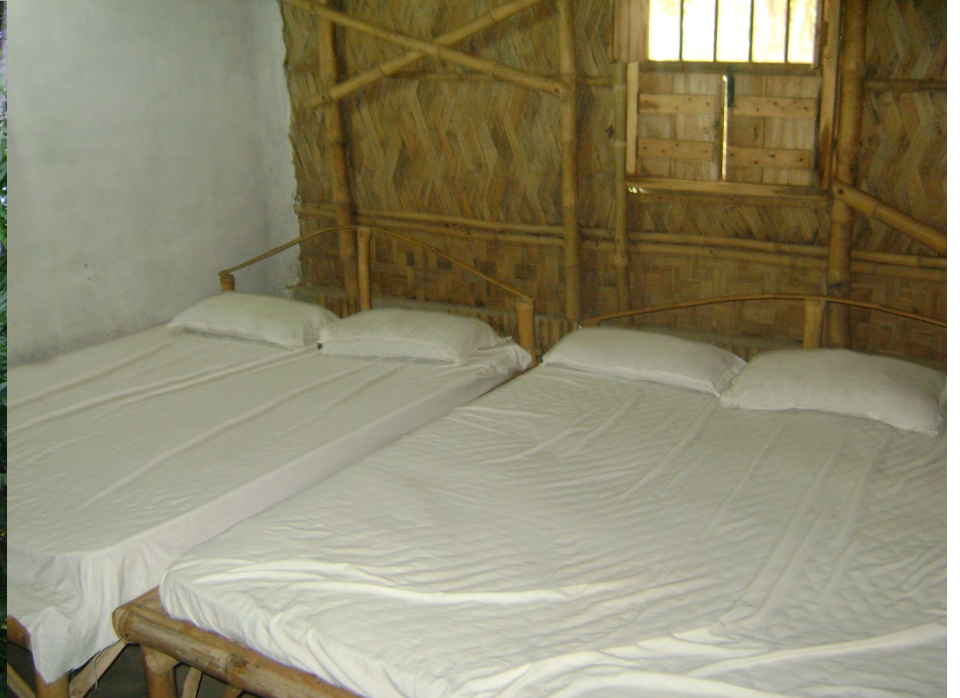
Rupasibangla represents the website name, the business owner is SEO Step Technology, New Delhi