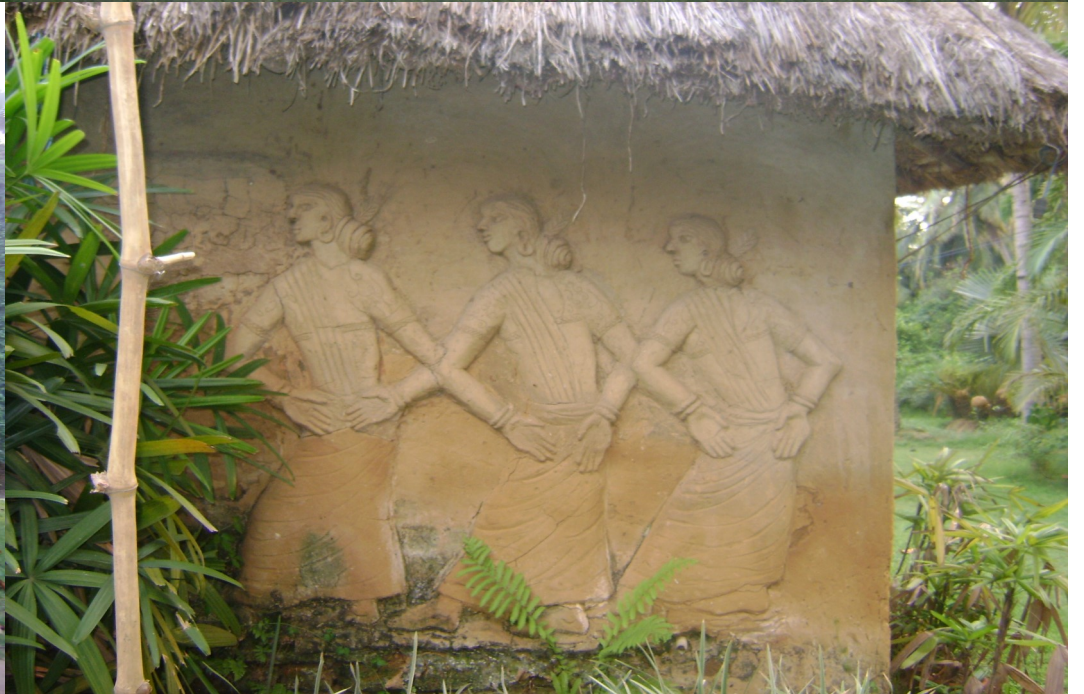
Rupasibangla represents the website name, the business owner is SEO Step Technology, New Delhi